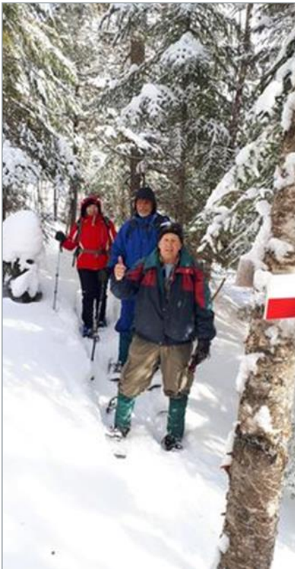
Bénévoles inspectant la coupe de bois près du sentier Chériore (SNQ) afin de s'assurer que les normes ont été respectées.