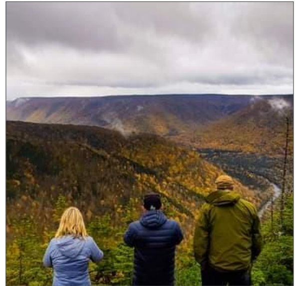
Randonnée dans les Highlands au Cap-Breton, en Nouvelle-Écosse, Cape Clear près de Chéticamp

Nous continuerons d'offrir des cours du Conseil canadien de plein air et des ateliers Renouer avec la nature. Le Hiker Challenge a vu la participation plus que doubler au cours de l'année dernière et nous développons de nouveaux badges régionaux. Un guide Guthook est en préparation pour l'International Appalachian Trail en Nouvelle-Écosse. Nous avons lancé un nouveau programme appelé NS Walks visant à impliquer les personnes moins actives dans des marches régulières dans leurs communautés locales par le biais de groupes de marche.