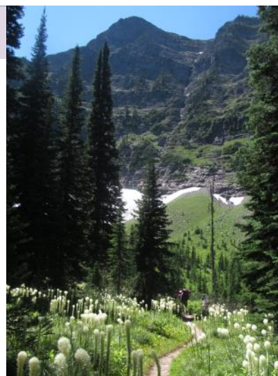
Parc national des Lacs-Waterton Le Great Divide Trail