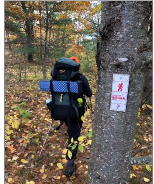
Sentier Ganaraska, dans le Parc provincial Queen Elizabeth II Wildlands, Ontario

Bien qu'il soit si important de donner aux gens la possibilité d'être dans la nature, il est impératif que nos sentiers soient soutenus, appréciés de manière responsable et non abusés. A bientôt sur les sentiers!